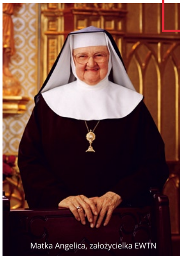
Matka Angelica, założycielka EWTN

Jesteśmy polskim oddziałem międzynarodowej sieci telewizyjnej EWTN założonej przez Matkę Angelikę w USA 40 lat temu. Dziś EWTN dociera do 150 krajów i obejmuje swoim zasięgiem ok. 220 mln gospodarstw na całym świecie. W Polsce chcemy pokazać to co święte i piękne w Kościele. Osoby i dzieła św. Maksymiliana Kolbego, św. Jana Pawła II, św. Faustyny, bł. ks. Jerzego Popiełuszki, Sług Bożych kard. Stefana Wyszyńskiego i ks. Franciszka Blachnickiego są dla nas inspiracją, a Jasna Góra, Niepokalanów, Łagiewniki, warszawski Żoliborz to miejsca, z którymi się identyfikujemy. Startujemy 19 października 2018 roku.